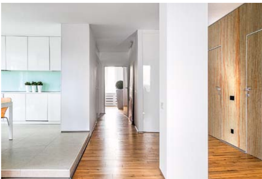
Адреса в конце журнала

с этим царством света, разбавленным акцентами в экологичной цветовой гамме. В соответствии с программой минимализма, в отделке нет ни одного лишнего элемента: межкомнатные двери встроены заподлицо, а входная и гардеробные сливаются с необычно отделанными стенами. Кажется, что некоторые предметы мебели, например кухонные шкафы, составляют со стенами единое целое, другие выделяются необычной формой: кресло напоминает огромную яичную скорлупу, диван и банкетка — кристаллы. Ремонт. На полу выполнили новую стяжку, стены выровняли штукатуркой, потолки — гипсокартоном. Стены оклеили обоями под покраску. Систему водоочистки и бойлер накопительного типа поместили в туалете за встроенным заподлицо люком-невидимкой, там же — доступ к водопроводным коммуникациям. Под плиткой смонтировали систему тёплого электрического пола. Кондиционером оборудовали только спальню, наружный блок поместили на фасаде дома. По решению архитектора все радиаторы и подводы к ним закрыли экранами, в которых для циркуляции воздуха сделали отверстия. При входе в гардеробную включаются светильники с датчиками движения. Жильё оборудовали системой Wi-Fi, спутниковым ТВ и домашним кинотеатром. Стены и потолок на лоджии покрасили, пол облицовали плиткой, сделали удобный подоконник-стойку (барную) из камня, к стенам прикрепили светильники.