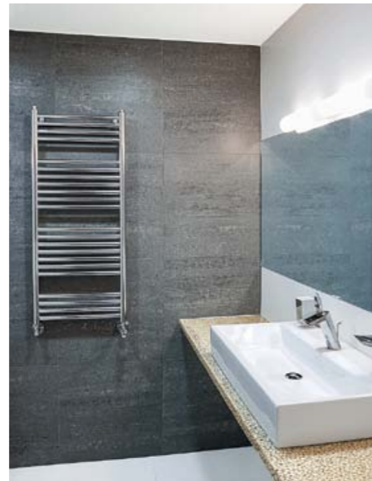
⊕ ⊖ Небольшие «природные» детали украсили ванную: так, внешний борт купели отделан под дерево, столешница под умывальником изготовлена по индивидуальному проекту из мелкой гальки, скреплённой эпоксидной смолой методом заливки в специальную форму