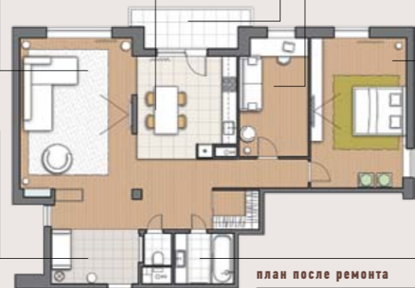
план после ремонта

ПОЛ: керамогранитная плитка СТЕНЫ: плитка керамическая САНТЕХНИКА: смесители Tres МЕБЕЛЬ: подстолье под умывальник (галька, эпоксидная смола) с тумбой для хранения — на заказ по чертежам архитектора СВЕТИЛЬНИКИ: потолочные Eglo